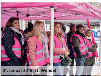
31. Januar 2019, St. Wendel