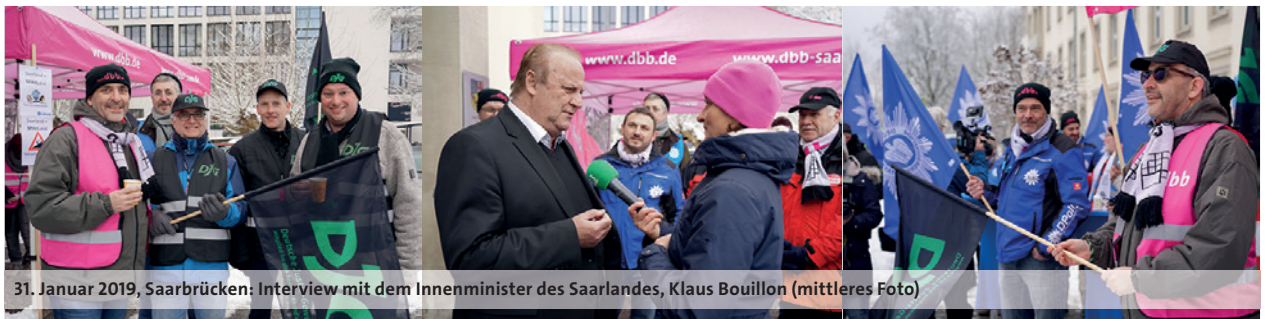
31. Januar 2019, Saarbrücken: Interview mit dem Innenminister des Saarlandes, Klaus Bouillon (mittleres Foto)

zung der Tabellenstruktur, die Bund und Kommunen bereits vollzogen haben, auch im Länderbereich kein Weg vorbei. Das Land Saarland darf trotz Haushaltsnotlage nicht länger personell ausbluten und Schlusslicht im Besoldungsranking bleiben.“